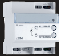
Télécommande par zone