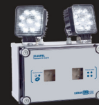
A phares SATI